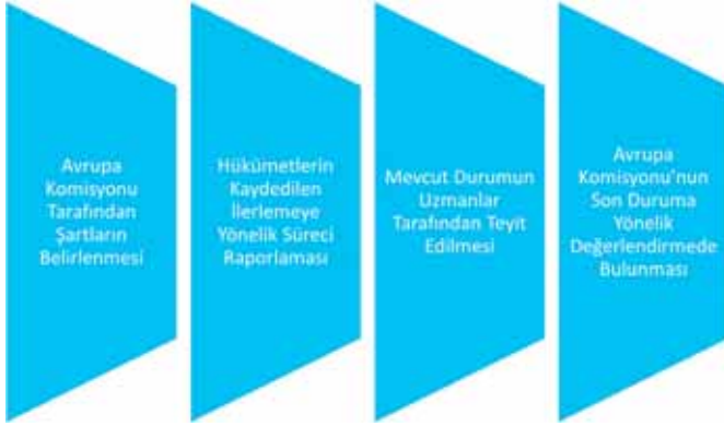
Şekil 4: Vize Yol Haritası Müzakerelerinde İzlenen Teknik Sürecin Aşamaları

Bu çerçevede Makedonya için süreç, ilk değerlendirmenin ardından tamamlanmıştır (Kasım 2008). Karadağ ve Sırbistan için de sürecin, Komisyon'un ikinci değerlendirmesinin ardından tamamlandığı söylenebilir (Mayıs 2009). Arnavutluk ve Bosna Hersek için ise süreçte, Aralık 2009 ve Eylül 2010 tarihlerinde birer değerlendirme daha yapılmış; en nihayetinde bu ülkeler için de süreç, Kasım 2010 tarihinde tamamlanmıştır.