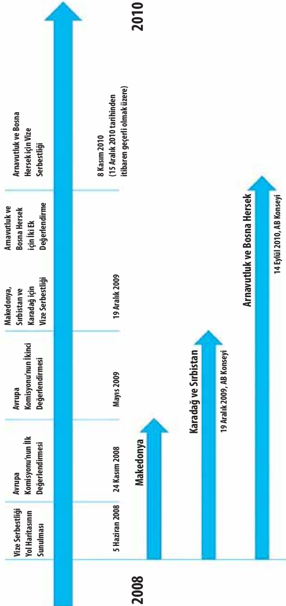
Şekil 5: Batı Balkan Ülkeleri için Vize Yol Haritaları Müzakere Süreci

diđi Arnavutluk ve Bosna Hersek için, Avrupa Komisyonu ve diđer AB kurumları, geri bildirimler ile süreci hızlandırma yolunu seçmişlerdir.