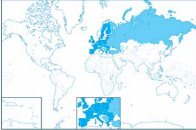
Şekil 1: AB'nin Vize Serbestleştirme Coğrafyası

Tarihsel perspektiften bakıldığında ise 2003 yılında ilk olarak Balkan ülkeleri ile başlayan süreç, sonrasında yine 2003 yılında Avrupa Komşuluk Politikası'nın kabulünün ardından Doğu Ortaklığı kapsamında Avrupa'nın doğu sınırlarına komşu ülkeler ile devam ettirilmiştir. Doğu Ortaklığı çerçevesindeki altı ülke ile 2009 yılından itibaren, vize serbestliği konusunda görüşmeler daha kapsamlı şekilde yapılmaya başlamıştır. AB ayrıca, 2007 yılından bu yana Rusya ve uzun bir süredir de Türkiye ile vize serbestliği konusunda müzakereleri sürdürmektedir.