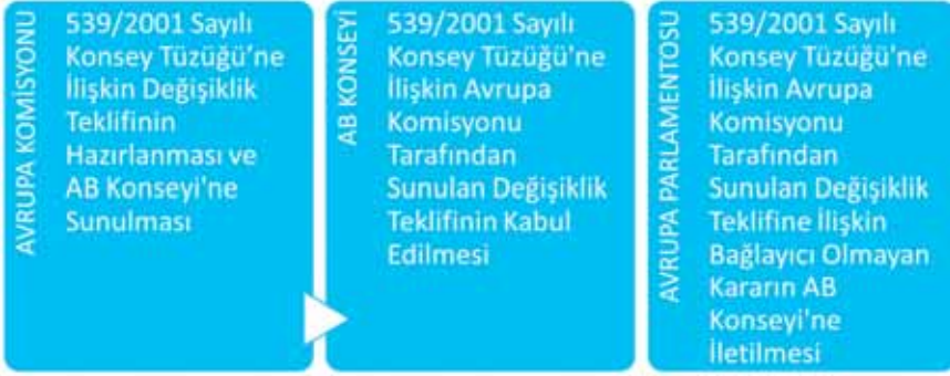
Şekil 7: Lizbon Antlaşması Sonrası Vizelerin Kaldırılması Konusunda AB’de Karar Alma Mekanizması (Arnavutluk ve Bosna Hersek için Geçerli Olan Mekanizma)