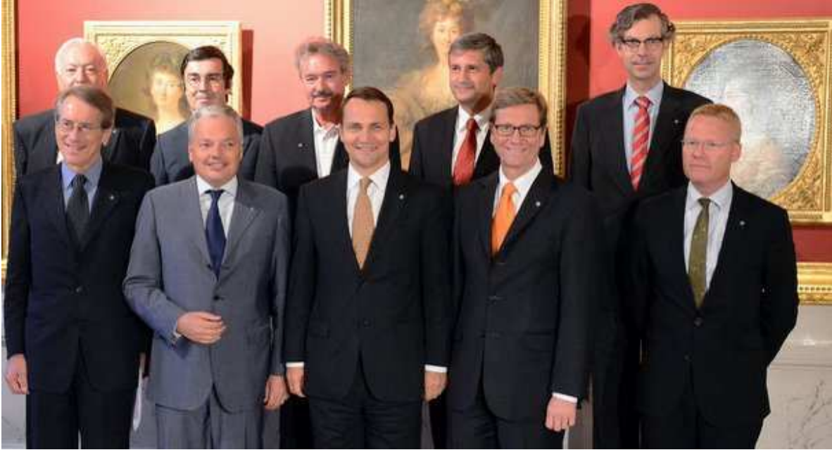
Avrupa'nın Geleceği Grubu'nun Varşova'daki nihai toplantısı

Almanya, Polonya, Avusturya, Belçika, Danimarka, Fransa, İtalya, Lüksemburg, Hollanda, Portekiz ve İspanya Dışışleri Bakanlarından oluşan Avrupa'nın Geleceği Temas Grubu, yedi ay süren beyin fırtınasının ardından 17 Eylül 2012 tarihinde Avrupa'nın gelecekteki mimarisine ilişkin görüşlerini içeren nihai karar bildirgesini 1 kabul etti.