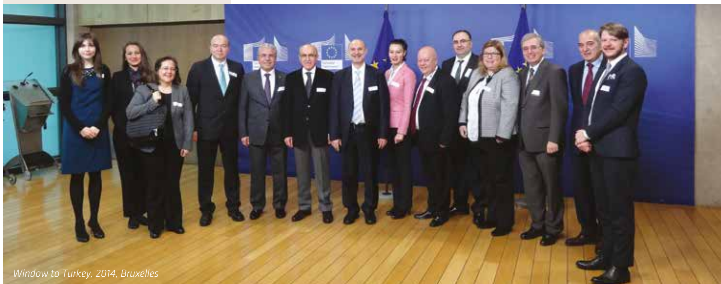
Window to Turkey, 2014, Bruxelles

Avec le soutien fourni par les représentants du milieu des affaires de Turquie, l'IKV assume un rôle de coordination dans les relations entre les institutions européennes et la société par rapport aux affaires européennes.