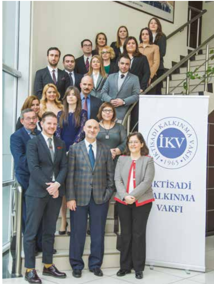
L'Equipe de l'IKV, 2015