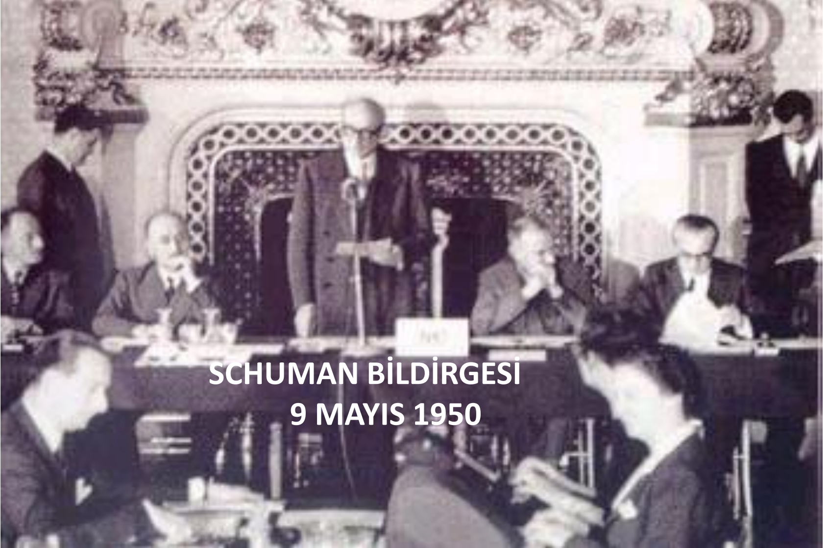
SCHUMAN BİLDİRGESİ 9 MAYIS 1950