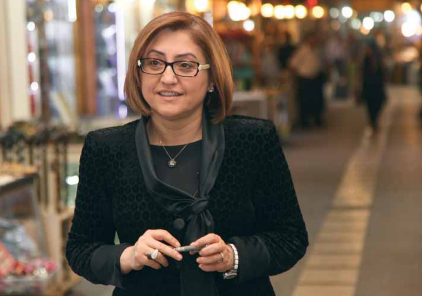
Fatma ŞAHİN Gaziantep Büyükşehir Belediye Başkanı

Bilimden siyasete, eğitimden sanat ve ticarete kadar yaşamın her alanında etkin olan ve başarılı çalışmalarıyla geleceği biçimlendiren kadınlar, üretici ve yaratıcı dinamikleriyle toplumu değiştirmeye devam ediyor.