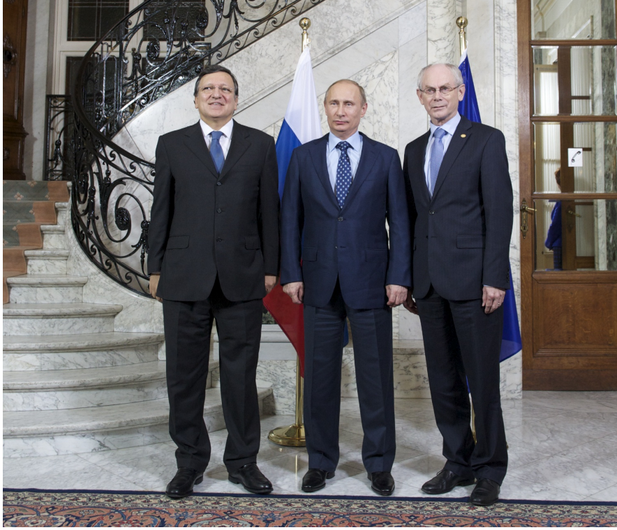
Avrupa Komisyonu Başkanı Barroso, Rusya Devlet Başkanı Vladimir Putin ve AB Konseyi Başkanı Herman Van Rompuy, AB-Rusya Zirvesi'nde, 20 Aralık 2012

AB-Rusya ilişkilerinin yasal dayanağını oluşturan Ortaklık ve İşbirliği Anlaşması ( Partnership and Cooperation Agreement - PCA ), 1994 yılında imzalanarak, 1 Aralık 1997 tarihinde yürürlüğe girdi. İlk etapta geçerlilik süresi on yıl olarak belirlenen anlaşma, 2007 yılı sonrasında da her yıl otomatik olarak yenilendi. AB ve Rusya arasında ortak hedefleri ortaya koymakla kalmayan PCA, aynı zamanda ikili ilişkiler için gerekli kurumsal çerçeveyi de oluşturmakta ve birçok alanda işbirliği ve diyalog zemini hazırlamaktaydı.