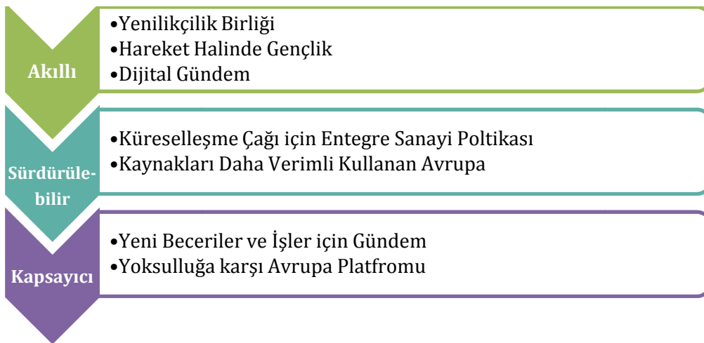
Şekil 1: Avrupa 2020 Stratejisi'nin yedi girişimleri

Hızla gelişen teknoloji ve küreselleşme olgusu ile ortaya çıkan yeni dünya düzenine karşı, AB kendi ekonomik ve sosyal yapısını güçlendirmek ve rekabet gücünü artırmak amacıyla önce Lizbon Stratejisi'ni (2000–2010) ardından da Avrupa 2020 Stratejisi'ni (2010–2020) kabul etti. Lizbon Stratejisi ile beklenen hedeflere 2010 yılında ulaşamayınca, Avrupa Komisyonu, Avrupa 2020 Stratejisi 1 ile AB'yi on yıl içinde bilgiye ve yenilikçiliğe dayalı, kaynakları verimli kullanan, çevreci ve daha rekabetçi ve aynı zamanda yüksek istihdam sağlayarak sosyal ve bölgesel uyumu destekleyen bir ekonomiye dönüştürme hedefini ortaya koydu. Üç temel sütundan ("Akıllı Büyüme", "Sürdürülebilir Büyüme" ve "Kapsayıcı Büyüme") oluşan Avrupa 2020 Stratejisi'nde yer alan önlemler de toplam yedi girişimden ( flagship ) oluşuyor (Şekil 1).